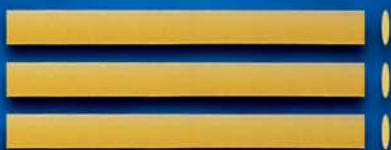
Tagliatelle n. 2