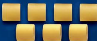
Ditali Lisci n. 58