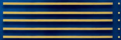
Capellini n. 16