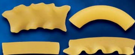
Mista n. 48