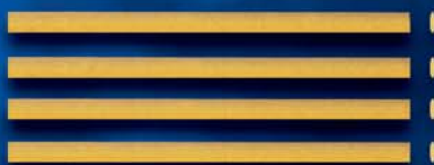
Lingue di Passero n. 3