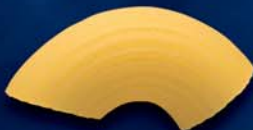
Gomiti n. 41