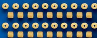
Corallini n. 71