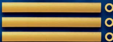
Regine n. 10