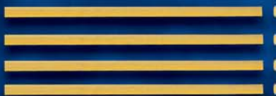
Linguine n. 4