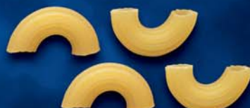
Fagiolini Rigati n. 50