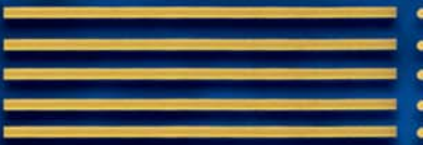
Spaghettoni n. 15