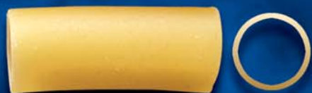
Occhi di Lupo n. 19