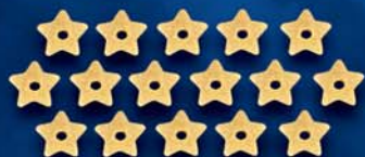
Stelline n. 74