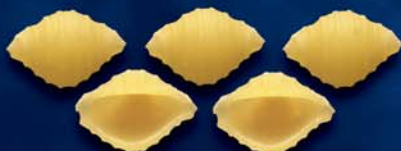
Mezze Cocciolette n. 54