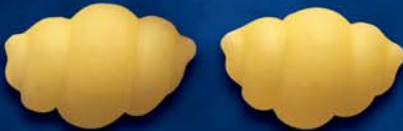
Gnocchi n. 39