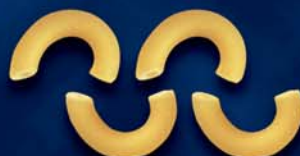
Coquillettes n. 101