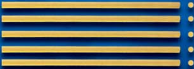
Spaghetti Vermicelli n. 13