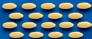
Seme Cicoria n. 70