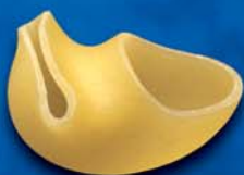
Lumache n. 44