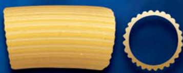
Mezzi Rigatoni n. 18