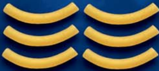
Stortini Bucati n. 67