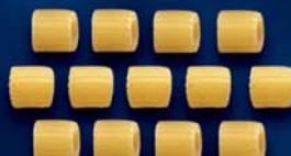
Tubetti Rigati n. 62