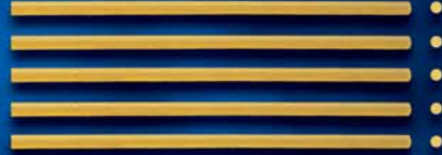
Spaghetti Ristoranti n. 14