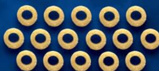
Anellini n. 73