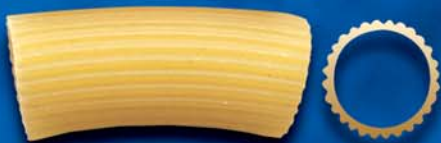
Rigatoni n. 17