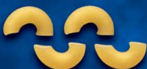
Fagiolini n. 49