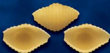
Cocciolette n. 53