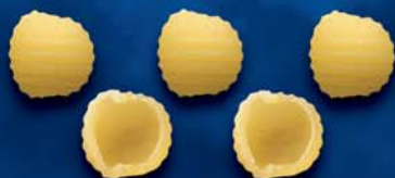
Scorze di Nocelle n. 52