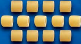
Tubetti n. 63