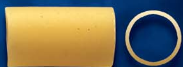
Mezzi Occhi di Lupo n. 20