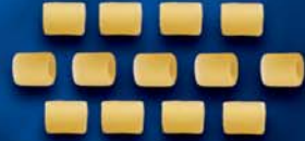
Tubettini n. 64