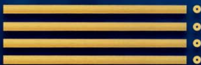
Bucatini n. 11