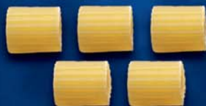
Ditali Rigati n. 59